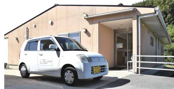
ご自宅にはコンパクトカーで訪問