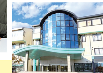
協力医療機関:藤田病院