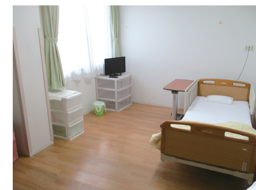
居室は全室個室です