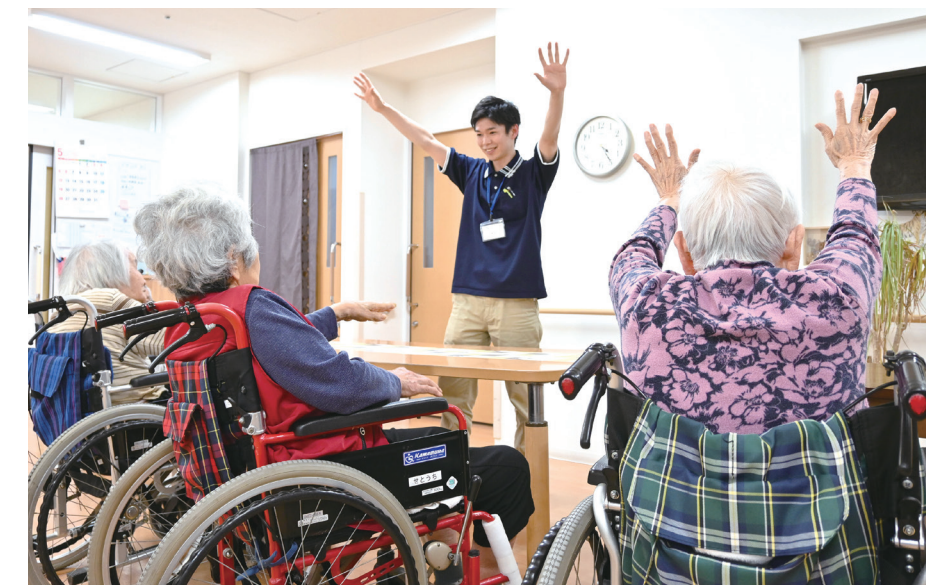
茶話会やイベントをお楽しみください