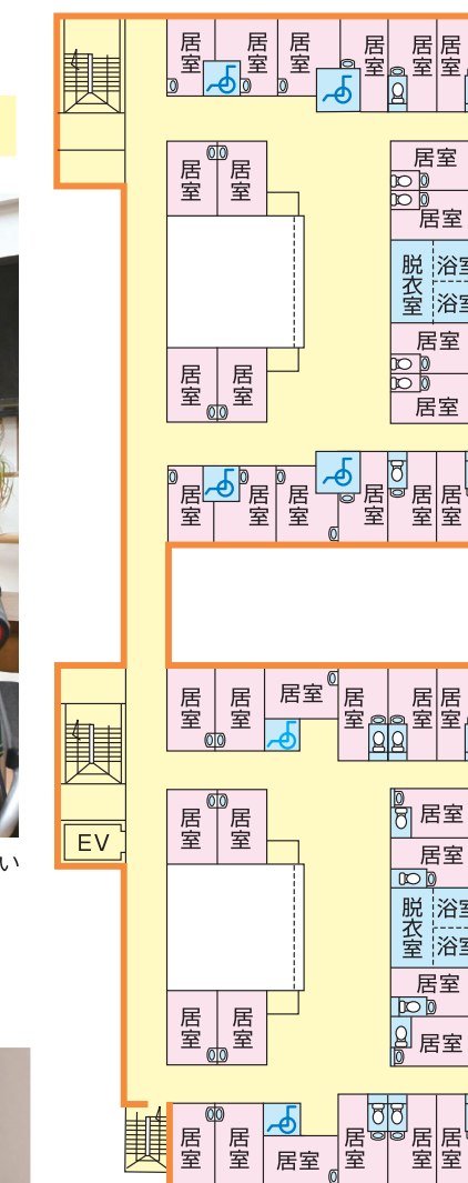
▲特養フロア平面図